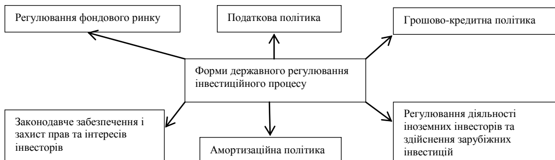
Рис.1. Форми державного регулювання інвестиційних процесів [17; с. 9].

Узагальнення важелів державного регулювання інвестиційного процесу наведено на рис. 1. [17; с. 8]