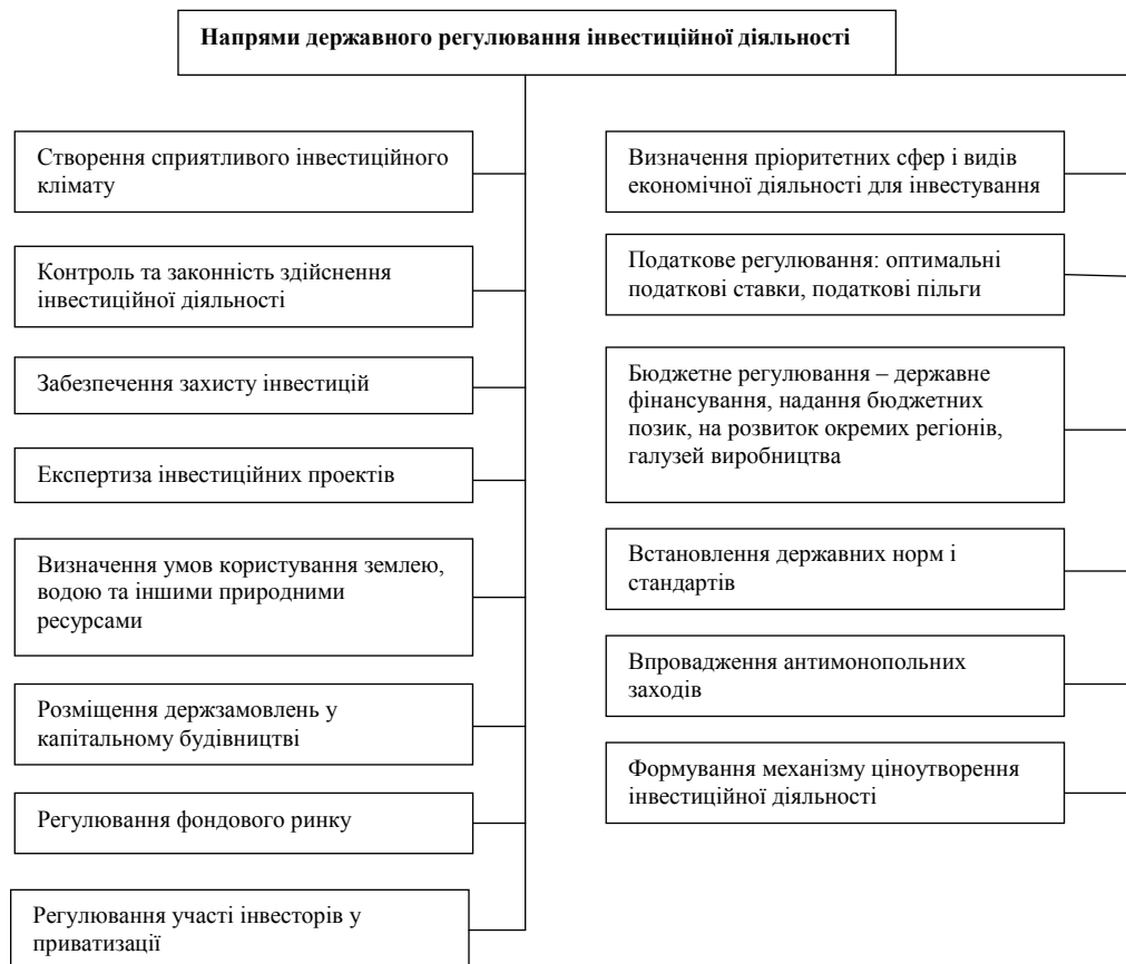
Рис. 4. Основні напрями державного регулювання інвестиційної діяльності [17; с. 10].

Для подальшого покращення інвестиційного клімату України актуальним на сьогодні є питання удосконалення напрямів державного регулювання інвестиційної діяльності, зокрема, правової та організаційної бази для підвищення дієздатності механізмів забезпечення сприятливого інвестиційного клімату й формування основи збереження та підвищення конкурентоспроможності вітчизняної економіки. Основні напрями державного регулювання інвестиційної діяльності наведені на рис. 4.